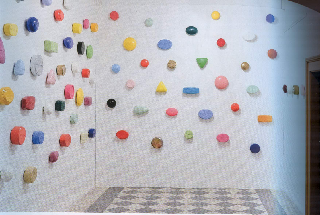
Marek Schovánek: Pharmatopia, 2013 – 2018, inštalácia, MDF drevotrieska, akrylová farba, lak, rôzne veľkosti, celkový pohľad a detail