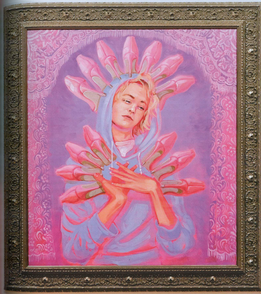
Lucia Dovičáková: Madona (Nemôžem ich mať všetky), 2017, akryl na plátne, 90 x 100 cm