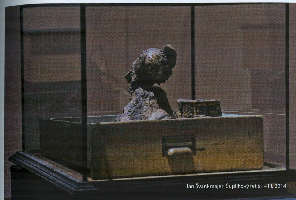
Jan Svankmajer: Šuplíkový fetiš I – III, 2014